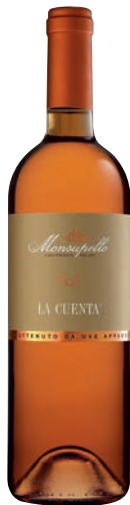
Moscato da uve appassite LA CUENTA