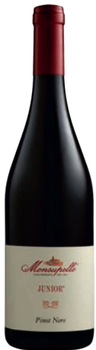
Pinot Nero JUNIOR