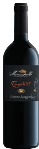
Cabernet Sauvignon TANGOWINE