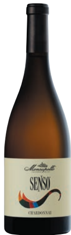
Chardonnay SENSÒ affinato in barriques