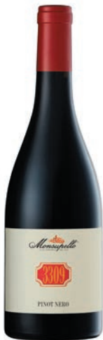
Pinot Nero 3309