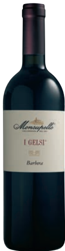
Barbera I GELSI