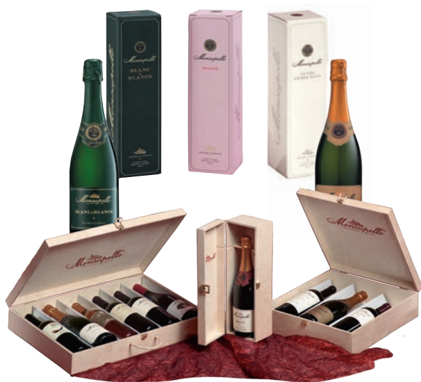
Astucci dello Spumante Classico

Cassette in legno personalizzabili con le selezioni dei nostri vini