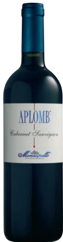
Cabernet Sauvignon APLOMB