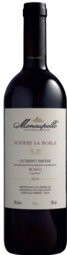
Rosso Oltrepò PODERE LA BORLA